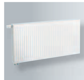
Vykurovacie telesá Ventil Kompakt