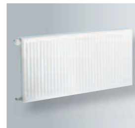
Vykurovacie telesá Kompakt