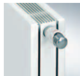
Čistá, hladká optika aj pri pohľade zhora, decentná tieňová drážka na boku