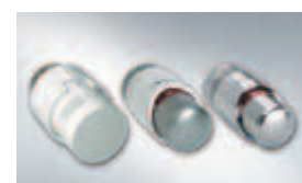
Termostatické hlavice Viessmann