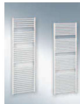
Kúpeľňové vykurovacie telesá